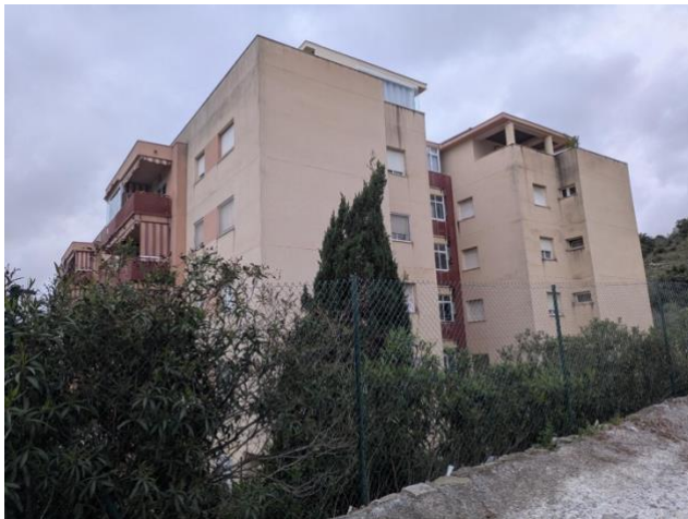
Wohnungsgebäude zweier Schülerinnen

Während der 12-tägigen Reise lebten alle Schüler und Schülerinnen in spanischen Gastfamilien. Dabei teilten sich zwei oder drei Personen eine Gastfamilie, welche teilweise auch zeitgleich andere Schüler*innen von der gleichen oder einer anderen Sprachschule betreute. Die Gastfamilien in Málaga wurden hierbei von der Sprachschule Carlos V ausgesucht und zur Verfügung gestellt, als Teil des gesamten gebuchten Programms. Das Leben in einheimischen Familien half den Schülern, das Leben in Spanien hautnah mitzuerleben und die theoretisch gelernten Inhalte des Spanischunterrichts in realen Situationen anzuwenden und die Kenntnisse zu verbessern. Des Weiteren sorgte es für eine intensivere Erfahrung der Lebensweise und Kultur, welcher durch einen Hotelaufenthalt nicht zustande gekommen wäre.