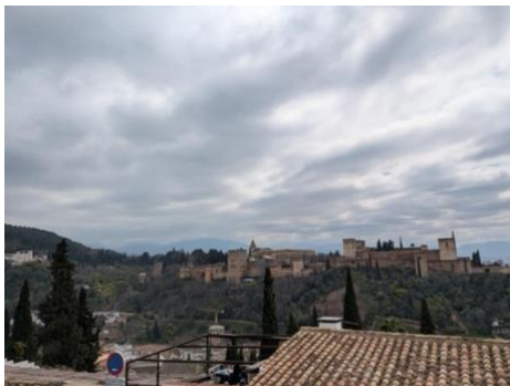
Aussicht auf die Alhambra

Der Tagesbesuch in die Stadt Granada, die Hauptstadt der Provinz Granada und sowie Málaga Teil von Andalusien, brachte die Schüler*innen und Lehrerinnen auf einen Hügel direkt gegenüber der Alhambra. Die Alhambra, ein riesiger Palast- und Festungskomplex, ist eines der bedeutendsten Denkmäler islamischer Kultur. Zwar war es der Gruppe nicht möglich die Alhambra direkt zu besuchen, aber der Ausblick auf das prächtige Gebäude war der Aufstieg definitiv wert. Danach besuchten wir noch die restliche Stadt und schauten uns in kleinen Gruppen ein wenig um, bevor es mit dem Reisebus wieder zurück nach Málaga ging.