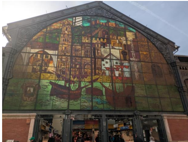
Mercado de Ataranazas