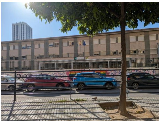
IES Ben Gabirol