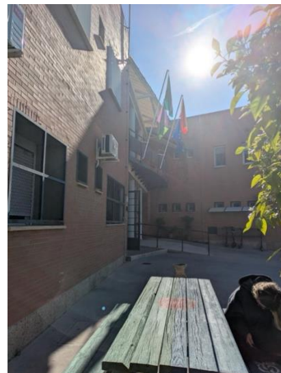
IES Ciudad Jardin