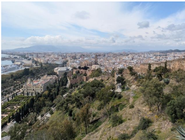
Aussicht auf Málaga (Aussichtsplattform)

Über zwölf Tage hinweg fuhren zehn Schüler*innen und zwei Lehrerinnen, die nach einer Woche tauschten, nach Spanien in die Stadt Málaga, die sich in der autonomen Region Andalusien befindet. Die gesamte Reise wurde von dem Erasmus+ Programm ermöglicht, das unserer Schule das Geld zur Verfügung stellte. Unser dortiger Aufenthalt wurde von der Sprachschule Carlos V organisiert, bei der unsere Schule ein Programm und einen Workshop gebucht hatte. Carlos V organisierte für die Schüler*innen Gastfamilien und sorgte für Besuche an Schulen. Zudem nahmen die Schüler*innen an einem Workshop in der Sprachschule teil. Neben den ganzen schulischen Aktivitäten hatten die Schüler*innen auch Freizeit, über welche sie frei verfügen durften. Im Ganzen sorgte diese von Erasmus+, Carlos V und unseren Lehrern organisierte Reise für wertvolle Erfahrungen bei Schüler*innen und Lehrerinnen.