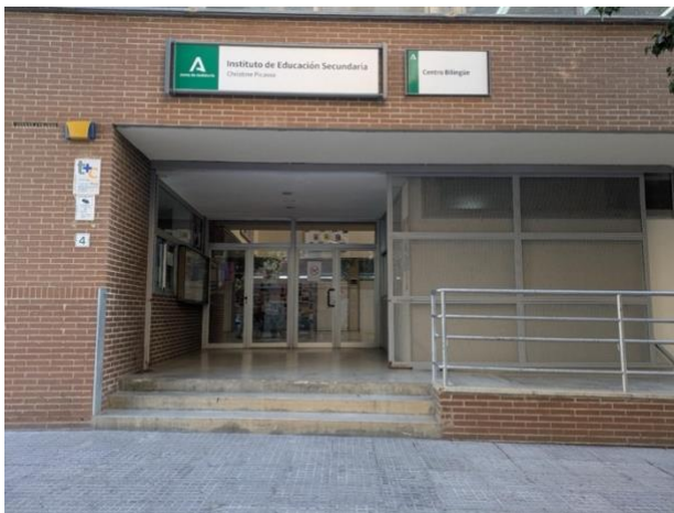
IES Christine Picasso

Wir lernten, dass in spanischen Schulen die Schüler, zumindest dort wo wir waren, jeden Tag 6 Stunden Unterricht haben, wobei jede Stunde 60 Minuten lang dauert. Zwischen den einzelnen Stunden gibt es eine kurze Pause, in der ein Lied über die Lautsprecher gespielt wird und in der die Schüler*innen und Lehrer*innen die Räume wechseln. Nach drei Schulstunden haben die Schüler*innen eine 30-minütige Pause, in der sie Essen oder sich auf dem Pausenhof vergnügen. Zu vermerken ist, das ich nicht genau sagen kann, ob dieser Alltag bei allen spanischen Schulen so stattfindet, es war jedoch so, bei den Schulen, die wir mit Carlos V besucht haben.